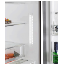
Two sides LED lighting